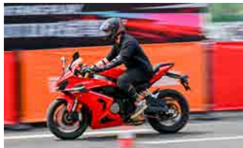
安全骑行活动 Safe Riding Activities