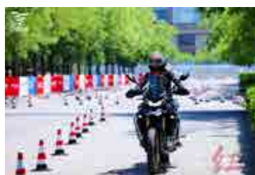
摩托车试乘试驾 Motorcycle Test Ride