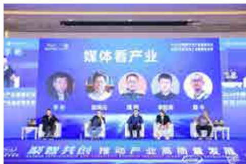
中国摩托车产业发展论坛 China Motorcycle Industry Development Summit