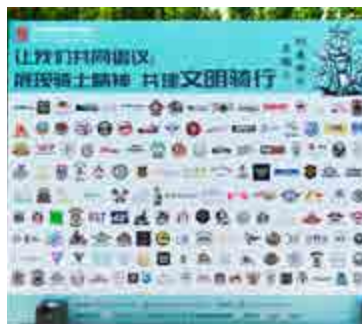
中国摩托车俱乐部联盟大会 China Motorcycle Club Association Conference