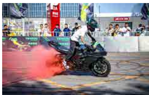
摩托车性能演示 Motorcycle Performance Show